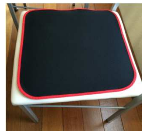
マルチマット(40cm×40cm) 定価 2,052円 ニシキ(株)

「防水・消臭・すべり止め」が三位一体となった「マルチマット」。その場で試用してみたら・・・たしかに滑らない(^) 待鳥さんのお話によると尿漏れが心配な方が、もしもの場合にもこのマットを敷いていけば防水はもちろん、スピーディに消臭してくれるんだそう。さらに、わたしが個人的にいいと思ったのは、この薄さ！持ち運びに便利なんです♪（だんだん回し者みたいになってきましたが、全くそんなことないですよ^^）；小さなお子様をもつママやシニア世代に人気のようです。さっそくわたしも、お客さまとの旅行の時にはリュックに忍ばせておきますので、使ってみてみたい方はご遠慮なくおっしゃってくださいね。